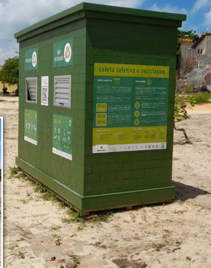
Campanha de educação ambiental em vigor em Jericoacoara e Preá